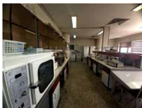
کتابخانه، سالن دکتر طوبی کرمانی، آزمایشگاه بیومدیکال