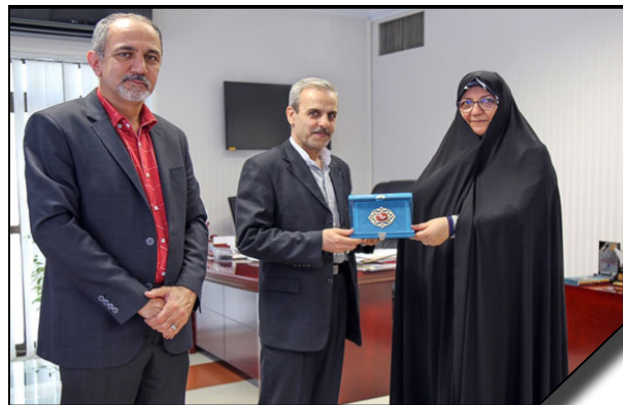
دیدار رئیس دانشگاه الزهرا (س) با سفیر جمهوری اسلامی ایران در قرقیزستان