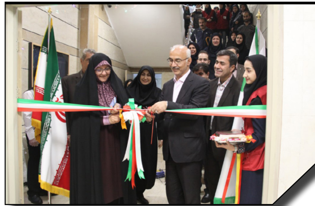
افتتاح مجموعه ورزشی سرای فرزنانگان دانشگاه الزهرا (س)