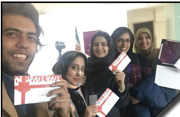
کسب مقام نخست در رشته طراحی لباس توسط گروه ریحانه النبی دانشگاه الزهرا (س) در رویداد هکاتون