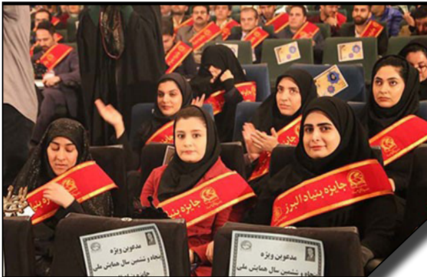
انتخاب دانشجوی دکتری رشته مشاوره و راهنمایی دانشگاه الزهرا (س) به عنوان برگزیده بنیاد فرهنگی البرز