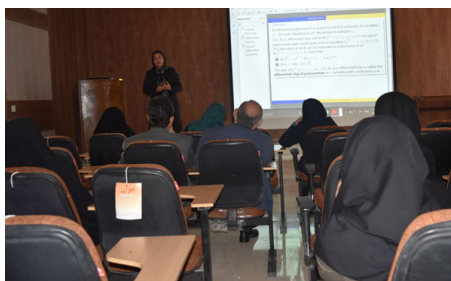
سخنرانی با موضوع Tropical Differential Geometry