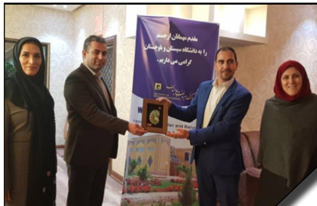
حضور نمایندگان دانشگاه الزهرا (س) در همایش "تعاملات دانشگاهی و آموزش محور توسعه پایدار ایران و افغانستان"