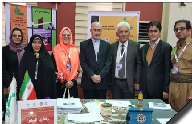
بازدید هیأت وزارت آموزش عالی عراق از دانشگاه الزهرا (س)