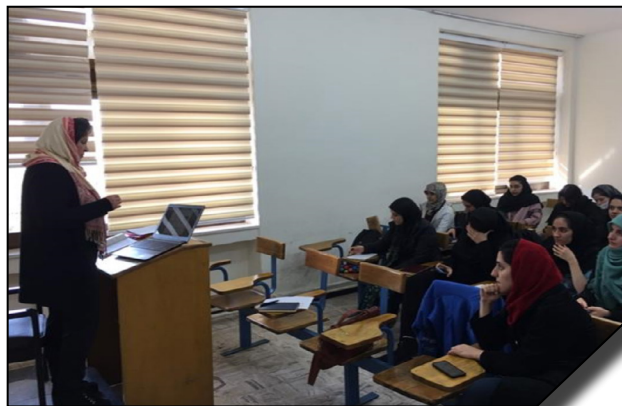
سخنرانی استاد دانشگاه ملی دونسک اوکراین با عنوان «میخائیل باختین، زبان شناس و فرهنگ شناس برجسته روس»