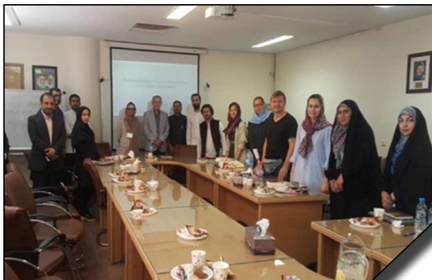
همکاری دانشگاه الزهرا (س) با دانشگاه ادیان و مذاهب در برگزاری هفتمین دوره بین المللی شیعه شناسی