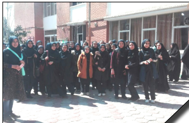
همکاری دانشگاه الزهرا (س) با مراکز آموزشی و انجام بازدیدهای دانش آموزی