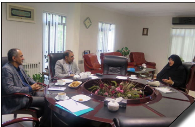
دیدار رئیس دانشگاه الزهرا (س) با رایزن فرهنگی جمهوری اسلامی ایران در تونس

از مجموعه غذاخوری دانشگاه الزهرا (س) - ۹۷/۱۱/۲۷