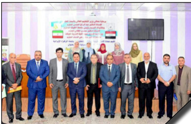
همکاری دانشگاه الزهرا و دانشگاه کوفه در برگزاری سمینار علمی بین المللی "به سوی محیط زیست عاری از آلودگی"