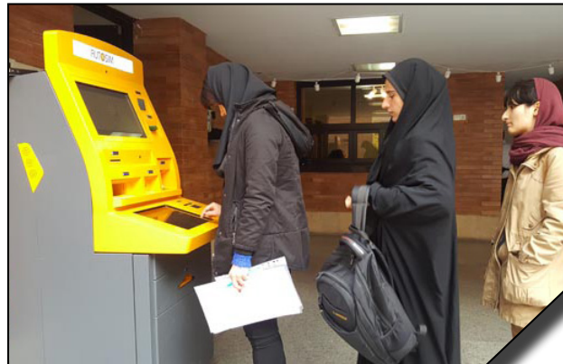
اجرای طرح رایگان سیم کارت برای دانشجویان