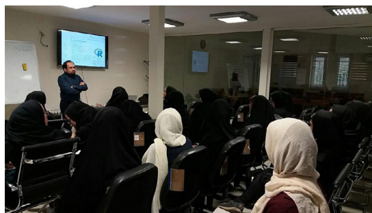
کارگاه معرفی مفاهیم نرم افزار R