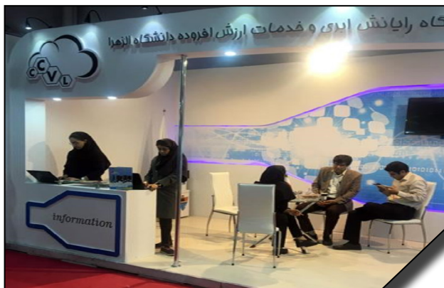
حضور دانشگاه الزهرا (س) در بیست و چهارمین نمایشگاه بین المللی ال کامپ