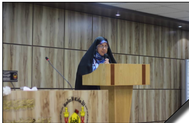
حضور مدیر گروه زبان و ادبیات عربی دانشگاه الزهرا (س) در همایش سالانه "الملتقى الفكرى الخامس لعقيلة الوحى"