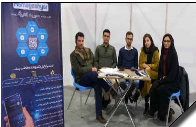
حضور استارت‌آپ‌های مرکز نوآوری دانشگاه الزهرا (س) در اولین نمایشگاه ربایتیک، اتوماسیون و هوش مصنوعی در اسفندماه ۹۷