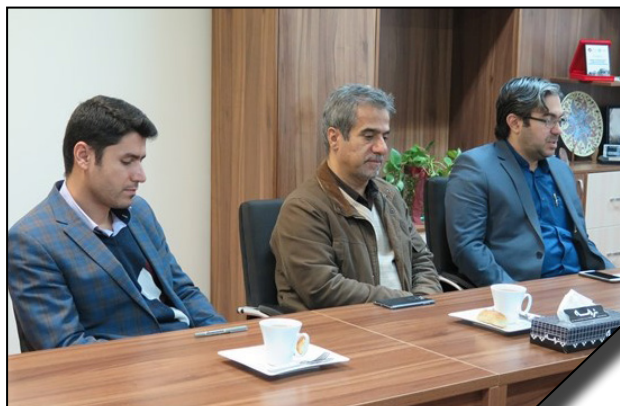
بازدید مسئولان سازمان مدیریت و برنامه ریزی کشور از ساختمان جدید شعبه ارومیه دانشگاه الزهرا (س)