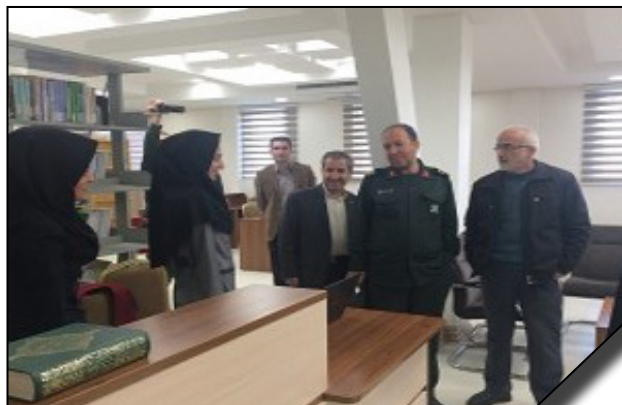
بازدید فرمانده سپاه شهدای آذربایجان غربی از شعبه ارومیه دانشگاه الزهرا (س)