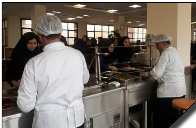
افتتاح خط ۴ سلف سرویس