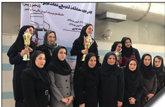
کسب مقام دوم قهرمان کشوری توسط تیم نجات غریق دانشگاه الزهرا (س)