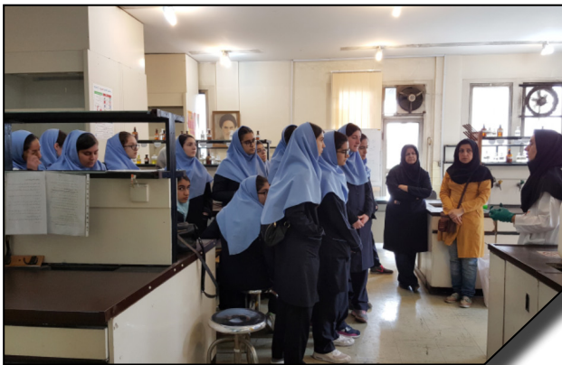
بازدید دانش آموزان دبیرستانی از امکانات دانشگاه الزهرا (س)