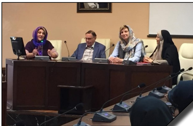
حضور اساتید و مسئولان دانشگاه دولتی زبان شناسی مسکو در دانشکده ادبیات دانشگاه الزهرا (س)