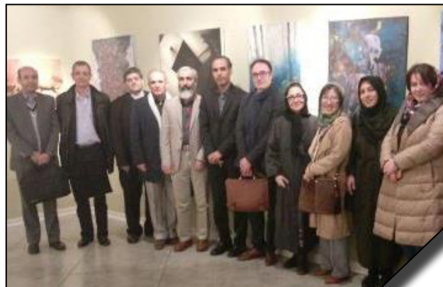
بازدید استادان دانشگاه فرانسه و گرجستان از دانشکده هنر