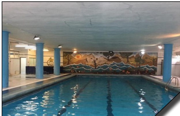
بازگشایی استخر دانشگاه الزهرا (س)