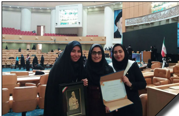
انتخاب انجمن علمی دانشجویی سلول‌های بنیادی و پزشکی بازساختی دانشگاه الزهرا (س) به عنوان انجمن برتر