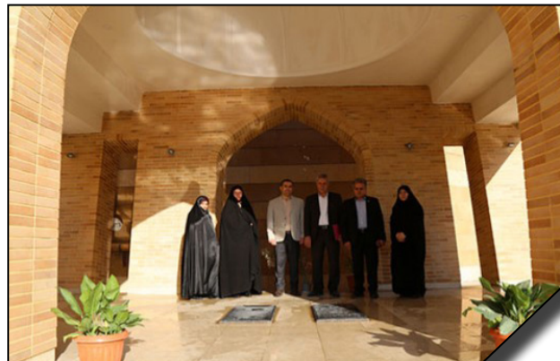
افتتاح بنای مزار شهدای گمنام دانشگاه الزهرا (س)