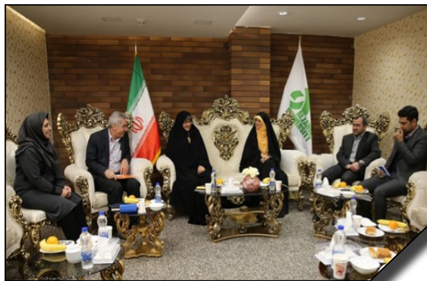
دیدار قائم مقام امور بین الملل و رئیس مرکز تعاملات بین المللی علم و فناوری ریاست جمهوری با رئیس و مسئولان دانشگاه الزهرا (س)