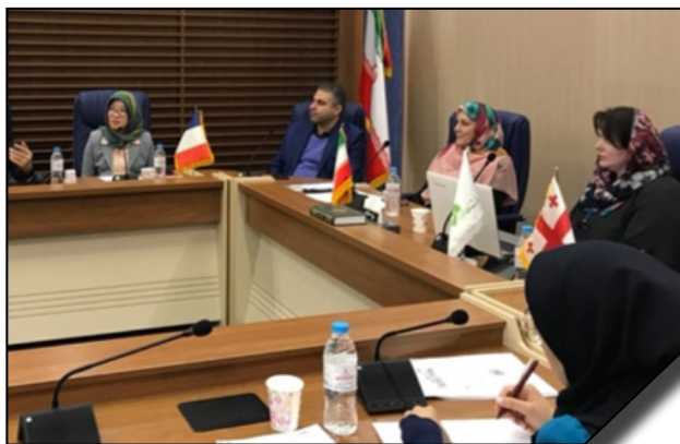
حضور مدیر دفتر اراسموس گرجستان در کارگاه آموزشی معرفی اراسموس در دانشگاه الزهرا (س)