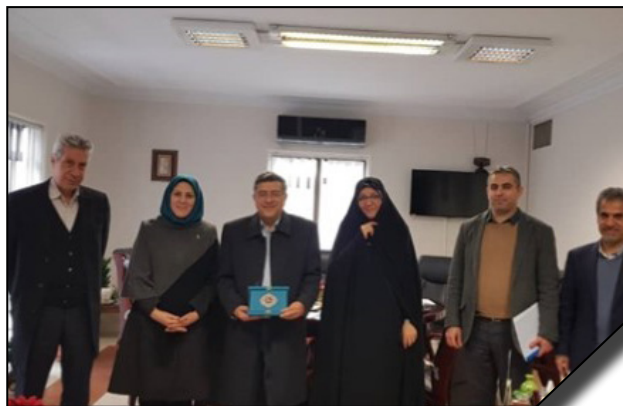
ملاقات رایزن علمی جمهوری اسلامی ایران در شرق آسیا با ریاست و مسئولان دانشگاه الزهرا (س)