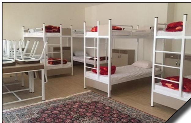
آماده‌سازی و تجهیز سرای دانشجویی جهت اسکان دانشجویان بین‌المللی و آرزفا