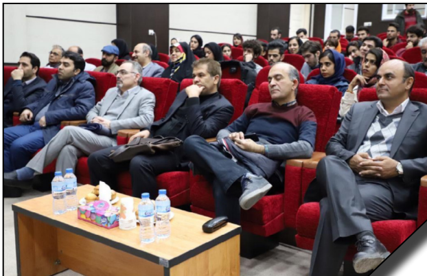
حضور عضو هیأت علمی دانشکده هنر دانشگاه الزهرا (س) در اختتامیه چهارمین نشست تخصصی و مسابقه ملی طراحی در صنایع دستی