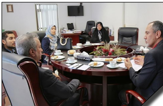
حضور سفیر جمهوری اسلامی ایران در غنا در دانشگاه الزهرا (س) و دیدار با رئیس دانشگاه