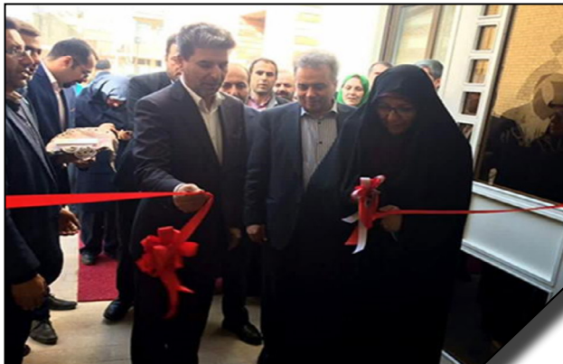
افتتاح ساختمان جدید شعبه ارومیه دانشگاه الزهرا (س)