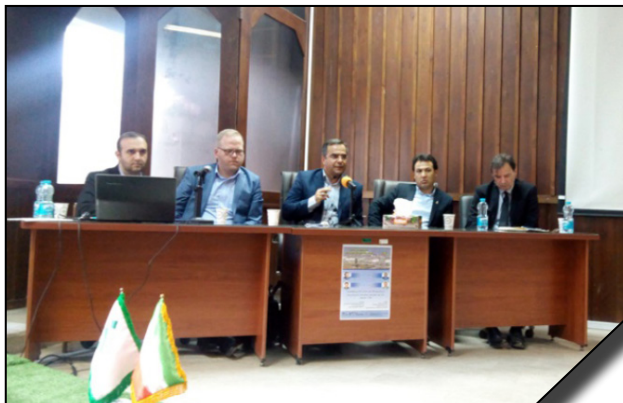
همکاری دانشگاه الزهرا (س) با موسسه روابط بین المللی راهبردی فرانسه در برگزاری کنفرانس مشترک اقتصادی "تولید ملی، موانع داخلی و چالش های بین المللی"