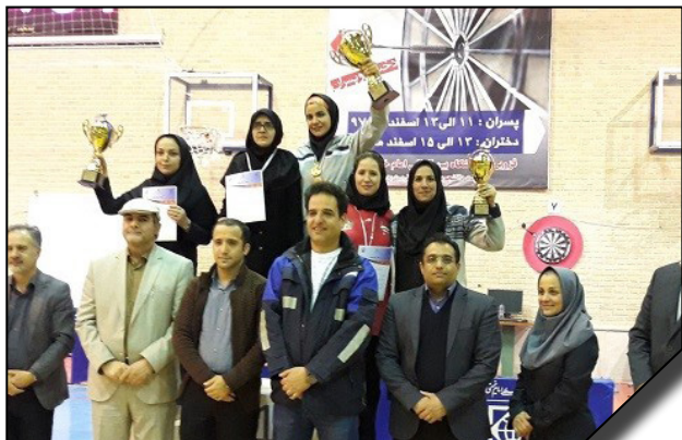
کسب مقام سوم قهرمانی تیم دارت دانشگاه الزهرا (س)