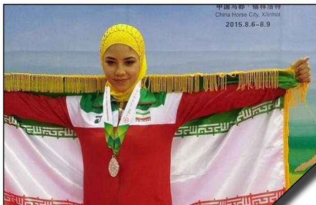
موفقیت دانشجوی تربیت بدنی دانشگاه الزهرا (س) در مسابقات بین المللی ووشو کاپ ۲۰۱۹