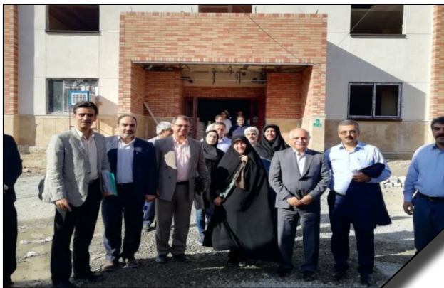
بازدید مسئولان سازمان مدیریت و برنامه ریزی کشور از ساختمان جدید شعبه ارومیه دانشگاه الزهرا (س)