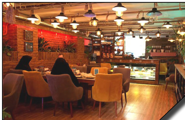
راه‌اندازی کافه تریا جدید در دانشگاه الزهرا (س)