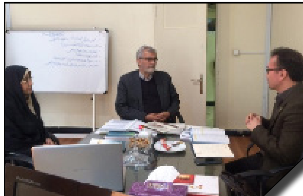
برگزاری نشست مشترک مرکز ارزیابی و پایش عملکرد دانشگاه الزهرا و دفتر نظارت و ارزیابی دانشگاه سمنان