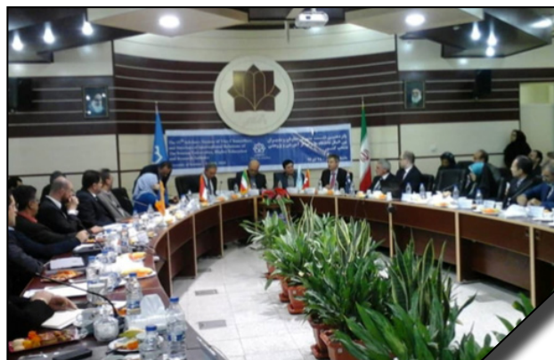
حضور دانشگاه الزهرا (س) در پانزدهمین نشست مشورتی معاونان و مدیران بین الملل دانشگاه‌های کشور