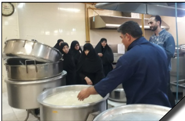
بازدید هیأت مدیره مجتمع فرهنگی روشنگر از رستوران دانشجویی دانشگاه الزهرا (س)