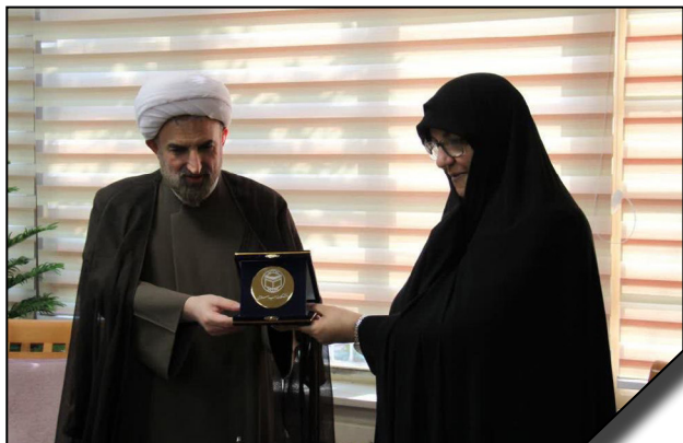
امضای تفاهم‌نامه همکاری میان دانشگاه‌های الزهرا (س) و مذاهب اسلامی

امضای توافق‌نامه برگزاری آزمون TORFL انستیتو پوشکین در دانشگاه الزهرا (س) در اسفندماه ۹۷