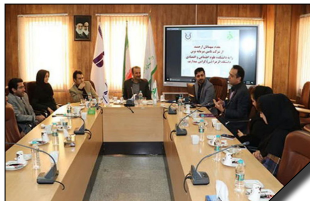
امضای تفاهم‌نامه همکاری میان دانشکده علوم اجتماعی و اقتصادی دانشگاه الزهرا (س) و گروه تأمین سرمایه نوین

انعقاد تفاهم‌نامه همکاری فیما بین معاونت آموزشی و تحصیلات تکمیلی دانشگاه و شرکت تعاونی توسعه و مبادلات اکسین یدک ایرانیان در راستای طرح مه‌دا - ۹۷/۹/۱۲